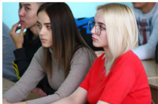
Фото участников конференции